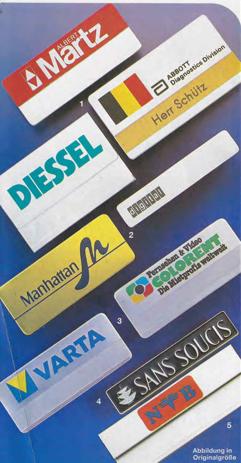
Abbildung in Originalgröße